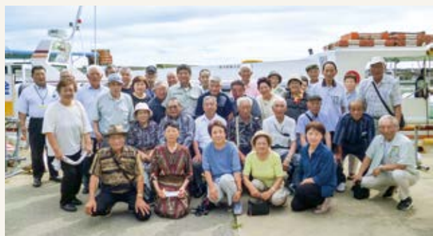
年金受給者友の会の45回目となる旅行が7月18日から19日にかけて開催されました。「日本海の幸 堪能と新潟瀬波温泉 ゆったりやすらぎ旅」と銘打ち、温泉旅館でのゆったりとした時間を満喫するとともに、景勝地「笹川流れ」の遊覧や鮮魚センターでのお買い物など、海沿いならではの観光を楽しみました。